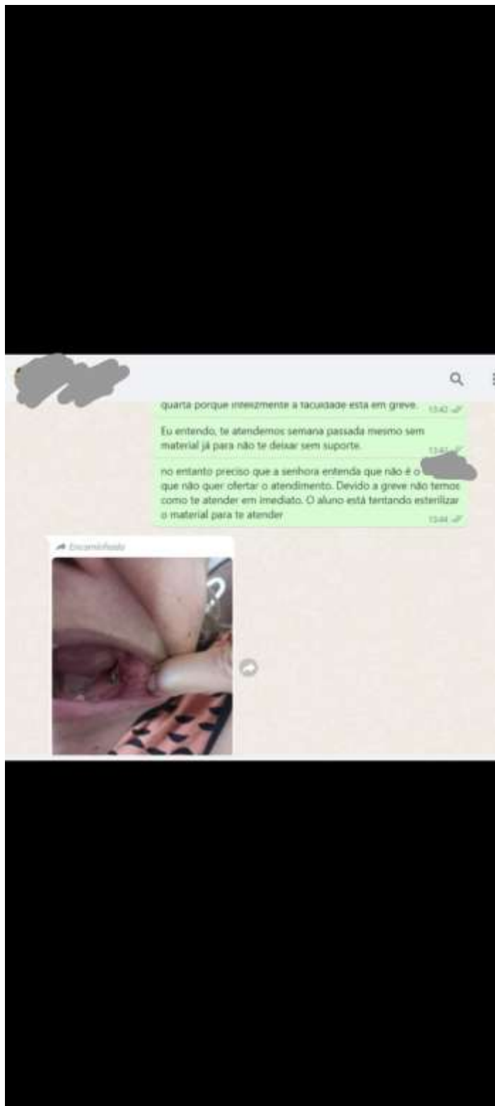
Figura 3. Perda de condições para implante dentário em fase de instalação.