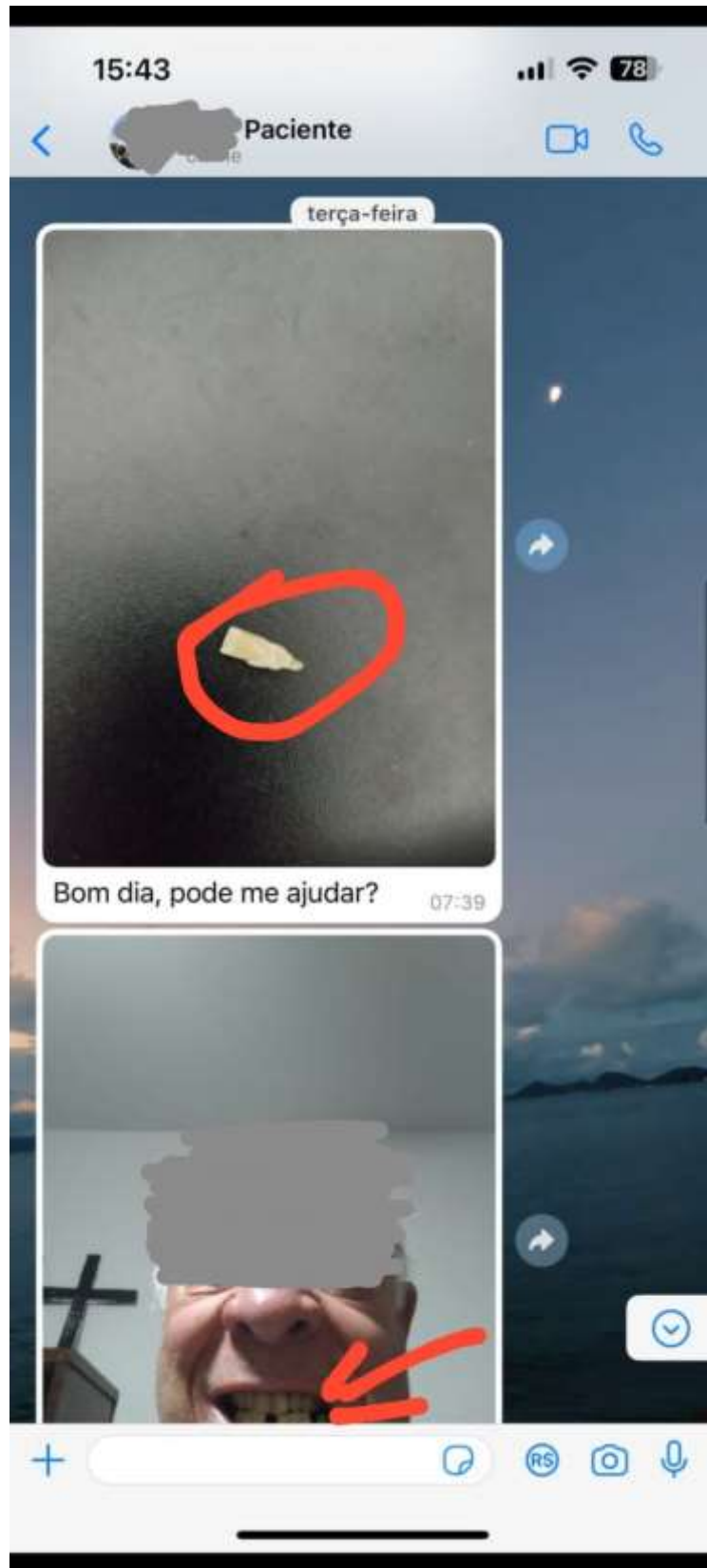
Figura 2. Perda de dente permanente.